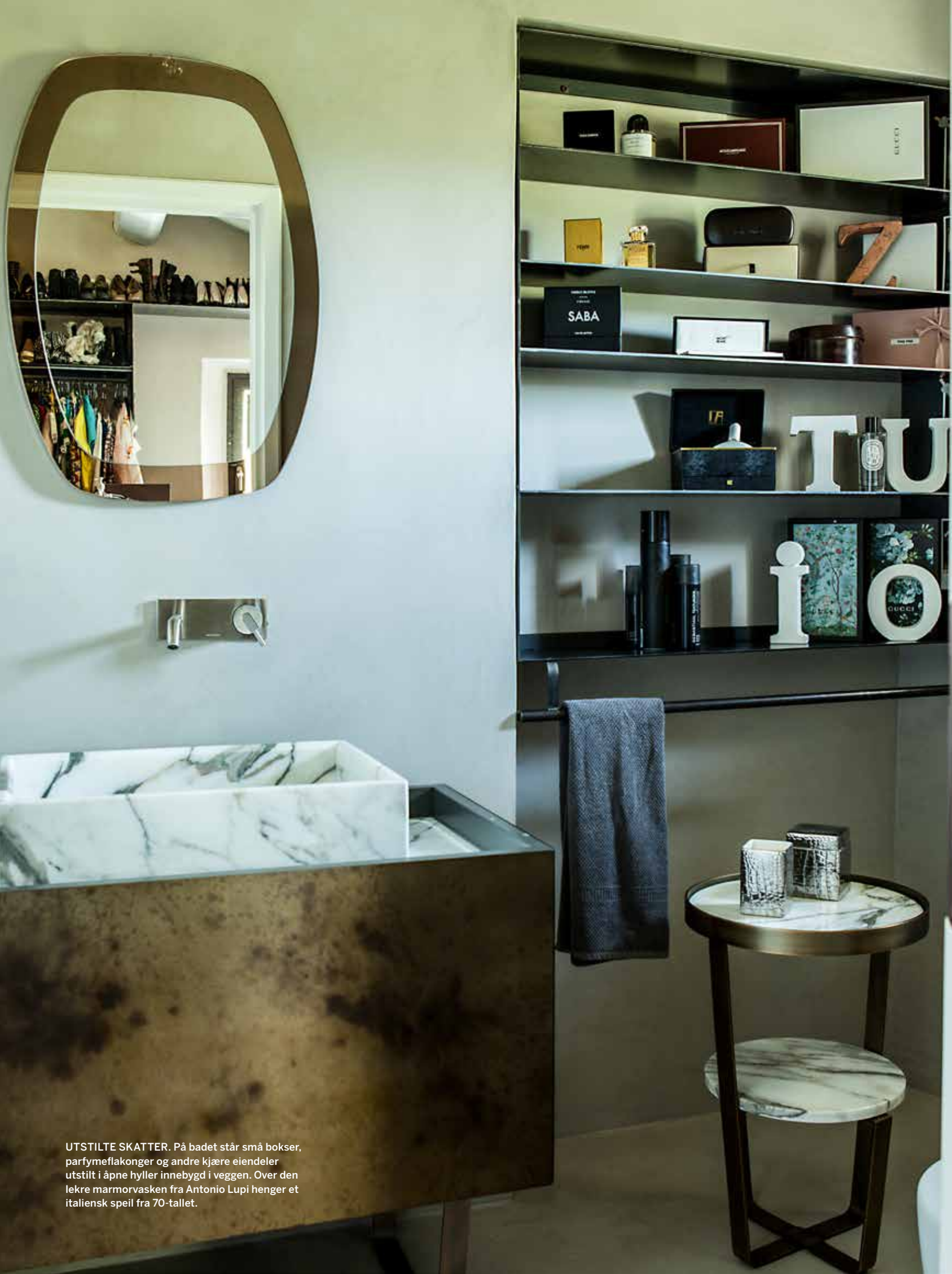
UTSTILTE SKATTER. På badet står små bokser, parfymeflakonger og andre kjære eiendeler utstilt i åpne hyller innebygd i veggen. Over den lekre marmorvasken fra Antonio Lupi henger et italiensk speil fra 70-tallet.